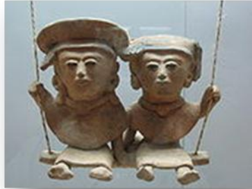
Amor fratern (figuretes prehispaniques de fang, 250-900 dC). Pobles indígenes del Centre de Veracruz. Museu d'Antropologia de Xalapa, Mèxic).