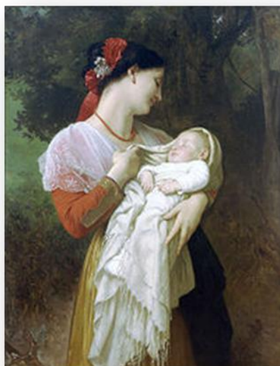
Amor maternal (quadre de William-Adolphe Bouguereau , 1869).

En les relacions de la persona amb el seu medi, l'amor pot presentar una o més d'una de les manifestacions següents: