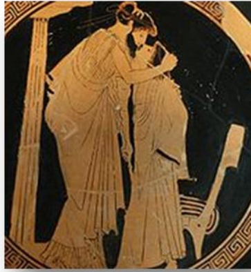
Representació de l'amor ( Erastés i Erómenos, Segle V aC ).