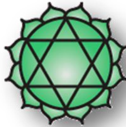
Quart Txakra, o Txakra del cor.

Així doncs, la filosofia oriental presenta una altra aproximació a l'amor espiritual, diferent de l'occidental: El patiment en si mateix no és el que ens fa virtuoses, sinó que és un mitjà per assolir la virtut, de tal manera que apropar-se a la il·luminació implica el cessament gradual del sofriment i l'augment del goig (incloent l'amor espiritual). Igual que en el cristianisme, el sofriment és un catarsi (o via d'expiació) que ens condueix a l'estat il·luminat (o a Déu).